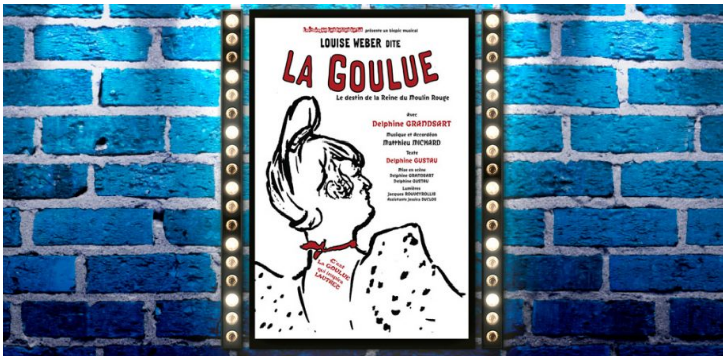
Figure incontournable de la Belle Époque, diva du Moulin Rouge, La Goulue a autrefois fait s’encanailler le tout Paris. Mais qui était-elle réellement ? Qui se cachait derrière ce